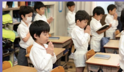
毎朝の朝礼 毎朝の朝礼は、朝の祈りです。全校で聖歌を歌い、神さまを賛美し、祈りをささげることから立教小学校の一日は始まります。