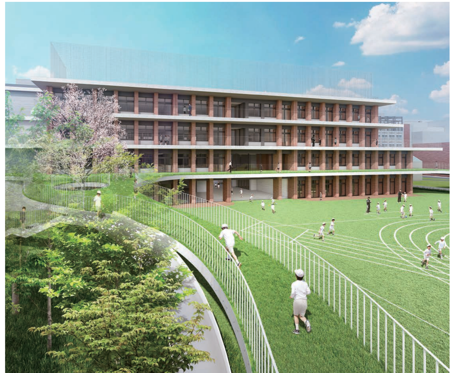
南側外観(イメージ)