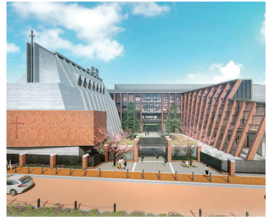
北側外観(イメージ)