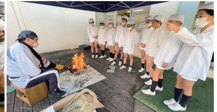
校長によるカツオのたたき