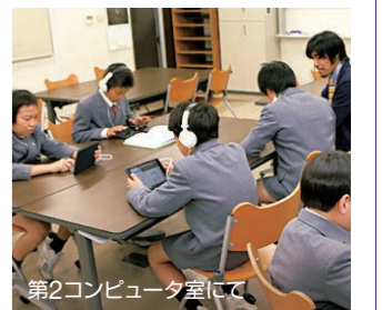
第2コンピュータ室にて

本校独自の教材を作成し「英語体験」を日常化することに努めています。6年生では、これまでのデジタル機器活用の集大成として、英語で自己紹介をするビデオ・レター作成による発信型の英語教育を実現しています。