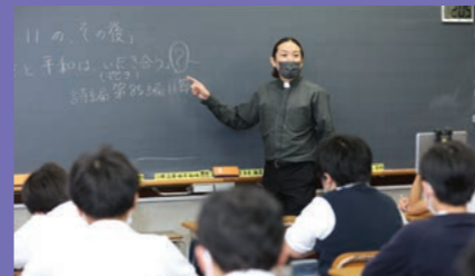
聖書科の授業 本校の教育の根底にはキリスト教の精神があります。小さい時から神さまを畏れ、感謝をもって生きる人を育てるということです。聖書科では、日々の授業を通して、その心を養います。実際には毎日過ごす学校生活全体を通して養います。知識というよりも、人としての生き方に大きな影響を与えるものです。特に、聖書から、神さまとはどのような方か、神さまに喜ばれる子どもとは何かを学びます。