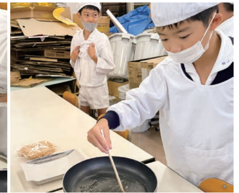
雷おこし用の水を混ぜている様子