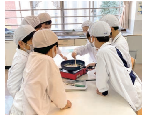
雷おこしを作成中