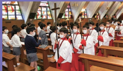
チャペルでの礼拝 毎週金曜日にチャペル礼拝をささげます。(1校時目：高学年、2校時目：低学年)チャペル礼拝では、聖公会の教会暦にしたがった聖書が読まれ、チャプレンのメッセージをききます。(移転期間中は代替校舎内で礼拝をささげます)