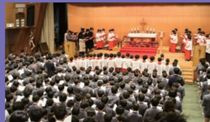
全校の礼拝 イースター、収穫感謝、クリスマス、設立記念日などには、全校児童が講堂に集まり、共同で大礼拝をささげます。この礼拝では、大きなプロセッションが組まれ、厳かな雰囲気の中で、保護者も一緒に祈りをささげます。