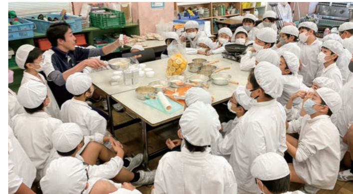
クリーミーレモン作り