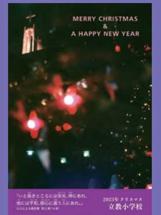
2023年度クリスマスカード