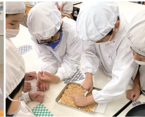
雷おこしを切断中