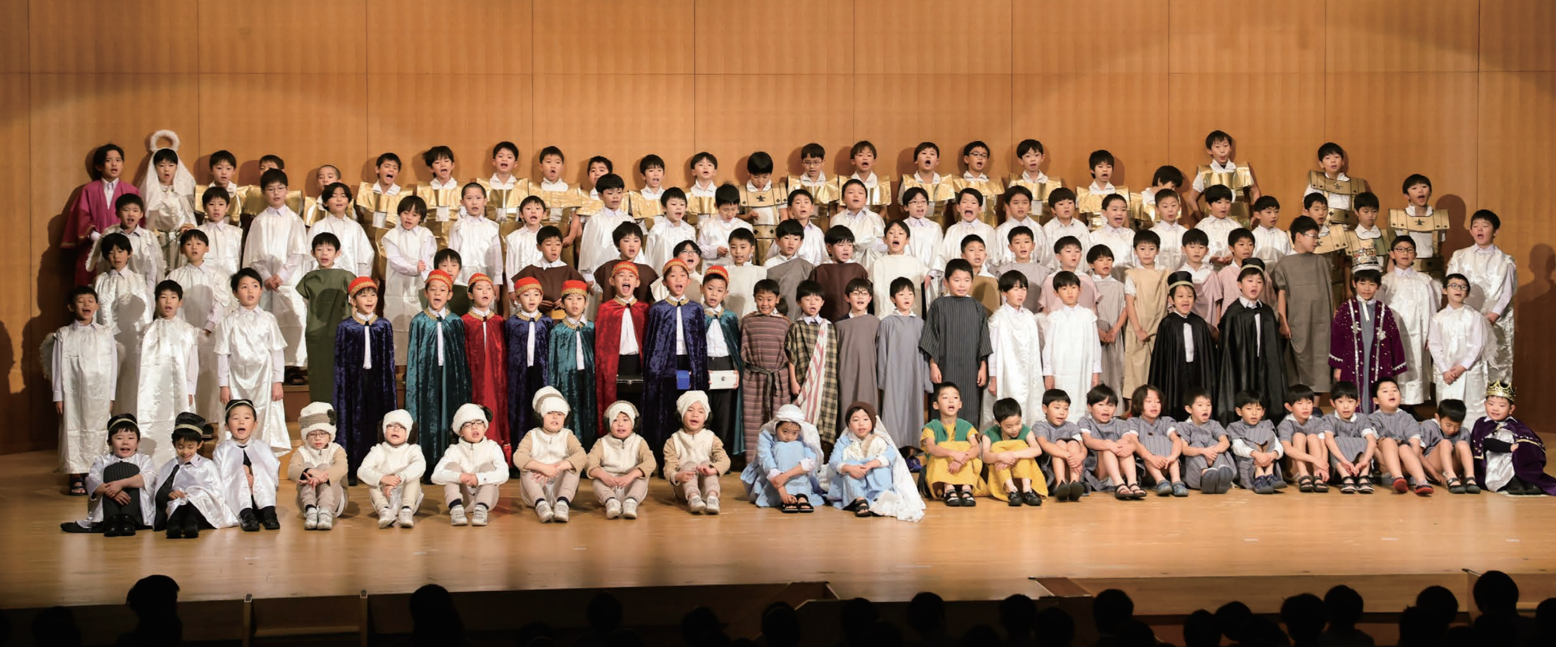
聖劇 毎年、クリスマス을祝して神さまにおささげする劇として2年生が行います。